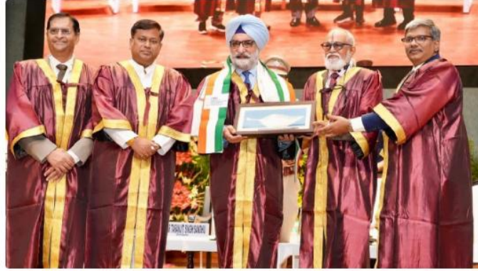
उपराज्यपाल तरणजीत सिंह संघू

दिल्ली में आयोजित आईसीएमएआई के 13वें राष्ट्रीय छात्र कॉन्वोकेशन 2026 में देशभर से आए नए कॉस्ट एंड मैनेजमेंट अकाउंटेंट्स को सम्मानित किया गया.