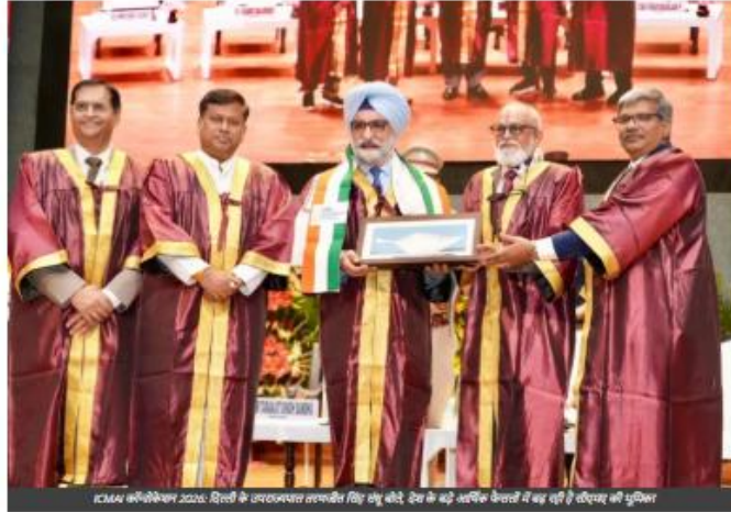
ICMAI कॉन्वोकेशन 2026: दिल्ली के उपराज्यपाल तरणजीत सिंह संधू बोले, देश के बड़े आर्थिक फैसलों में बढ़ रही है सीएमए की भूमिका

digitalfocusnews 22/05/2026 1 minute read