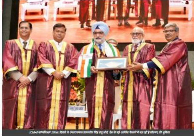
ICMAI कॉन्वोकेशन 2026: दिल्ली के उपराज्यपाल तरणजीत सिंह संधू बोले, देश के बड़े आर्थिक फैसलों में बढ़ रही है सीएमए की भूमिका

JA Bureau 1 week ago (Last updated: 1 week ago) 0 comments