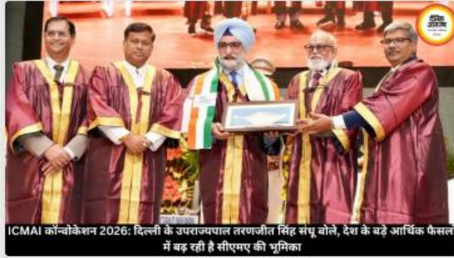
ICMAI कॉन्वोकेशन 2026: दिल्ली के उपराज्यपाल तरणजीत सिंह संघू बोले, देश के बड़े आर्थिक फैसलों में बढ़ रही है सीएमए की भूमिका

1,200 से अधिक प्रतिभागियों की मौजूदगी में आयोजित भव्य समारोह में शैक्षणिक उत्कृष्टता, पेशेवर नेतृत्व और विकसित भारत 2047 के विजन पर जोर