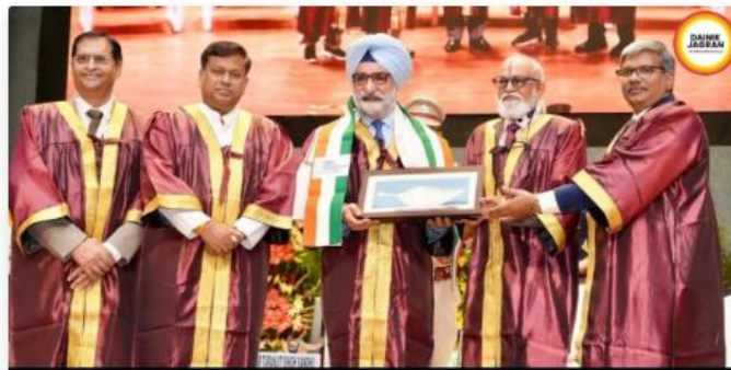
“CMAs Are at the Core of India’s Economic Decision-Making”: Delhi LG at ICAI Convocation

Over 1,200 participants attend grand ceremony celebrating academic excellence, professional leadership and India’s journey towards Viksit Bharat 2047.